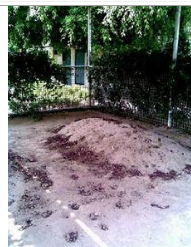
Grave of Syed Abul Aala Maududi