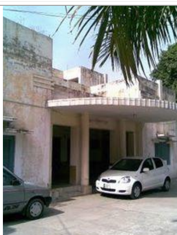
Main entrance of the House of Syed Abul Aala Maududi 4-A, Zaildar Park, Ichhra, Lahore